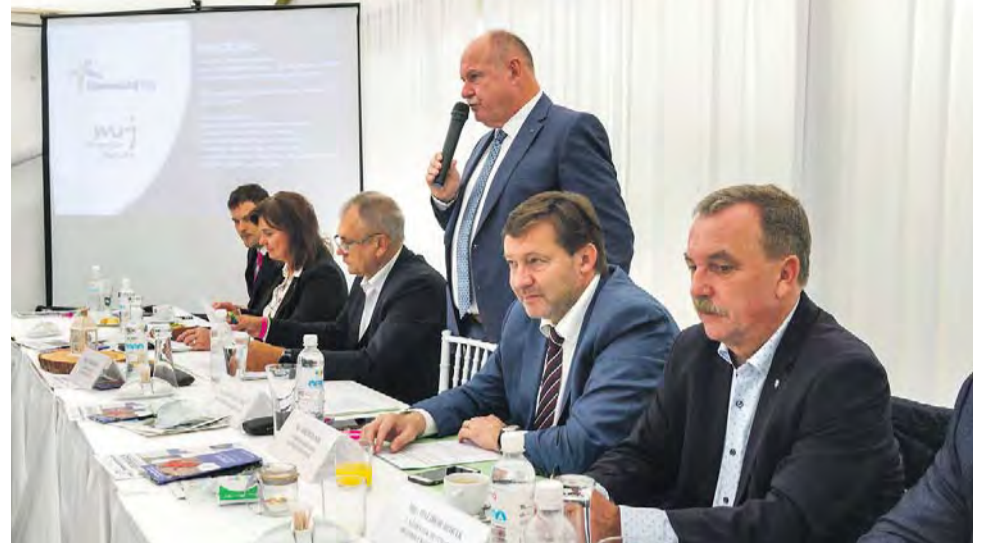
Na setkání v Horní Lipové se mluvilo o opravách silnic a plánované výstavbě obchvatů. Zástupci kraje účastníci ujistili, že současný stav veřejné dopravy v regionu zůstane stejný.

Hejtmánova slova potvrzují například rozsáhlé investice do dopravní infrastruktury v severní části kraje. Opravy silnic byly ostatně nejdiskuto-