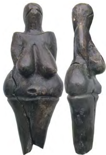
Nejstarší keramický předmět na světě je vysoký 11,5 centimetru.

V předvánočním čase bude 11,5 centimetru vysoká soška, jejíž hodnotu v roce 2004 odhadli američtí starožitníci na 40 milionů dolarů, představena v Olomouci