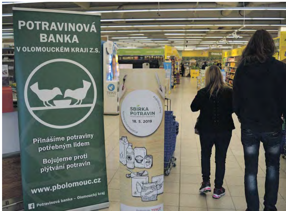
Darovat potraviny nebo drogerii bude v kraji možné v devíti městech.

Lidé mohou nakoupit potraviny nebo drogerii přímo v obchodě a za pokladnou zboží darovat zastupcům a dobrovolníkům z humanitárních organizací či sociálních služeb. Darované potraviny a drogerie pak poputují seniorům, matkám samoživitelkám,