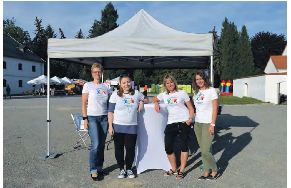
O druhý ročník akcí pro pěstouny byl zájem, kraj už proto připravuje pokračování.

Děti si mohly užít dětskou zónu s mnoha atrak-