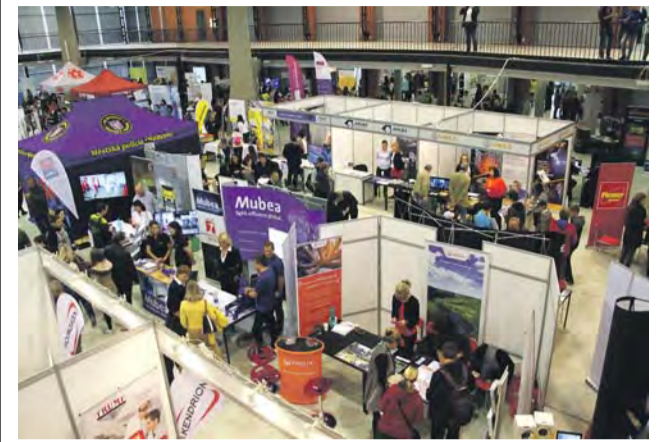
Burza práce nabídne na olomouckém výstavišti Flora nové možnosti nejen nezaměstnaným a čerstvým absolventům.

Přes padesát nejvýznamnějších zaměstnavatelů z Olomouckého kraje z různých odvětví se představí 22. října na Burze práce a vzdělání v pavilonu A olomouckého výstaviště Flora. Prezentovat se bude i 25 středních a vysokých škol.