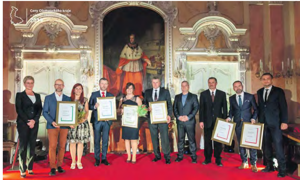
Ceny cestovního ruchu jsou dobrým doporučením na výlet nebo dovolenou. Letos nabídky například tipy na nejlepší pobyt u vody nebo originální regionální produkty.

Cenu hejtmána si odnesl šéf odboru Klubu českých turistů Značkaři