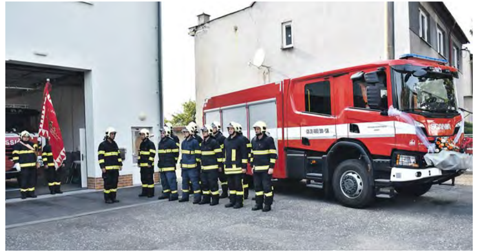
Nová stříkačka za 6,6 milionu korun nahradila v Hranicích třicet let starý vůz.

Projekt „Hranice - Cisternová automobilní stří-