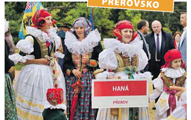
Hanáci si mohou poznačit datum 28. září 2020, kdy bude velké společné setkání se stovkami účastníků.

Letošní desáté Setkání Hanáků doputovalo do Přerova po Velké Bystřici, Doloplužech, Tovačově, Prostějově, Zábřehu, Olomouci a Čechách pod Kosířem. „Letos se konalo takzvané malé setkání, na příští rok ve stejný čas, tedy 28. září, připravíme velké Setkání Hanáků s hejtmánem Olomouckého kraje, kterého se tradičně účastní více než osm set