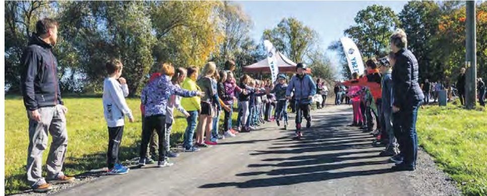
Dalším dílkem k propojení obcí podél Bečvy je 1,5 kilometru cyklostezky mezi Skaličkou a Ústím.

„Nová část cyklostezky odvede kolaře ze silnice II. a III. třídy. A to nejen ve Skaličce, ale také v okolních obcích - Ústí, Milotičkách nad Bečvou, Hustope-