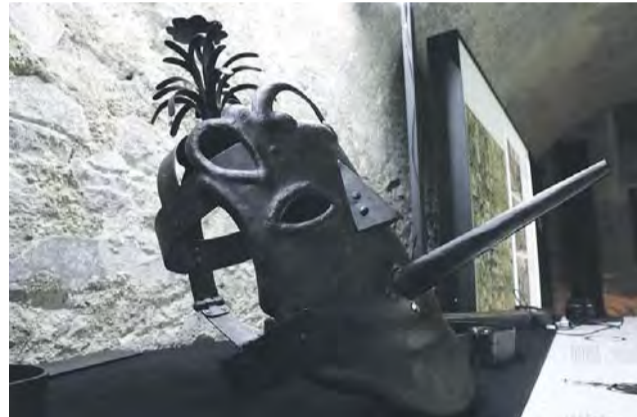
Výstava je přístupná celoročně. Návštěvníci mohou využít i studijní místo s digitalizovaným archivním materiálem.

Na Jesenicku procesy s čarodějnicemi trvaly přes sedmdesát let a počtem obětí, rozsahem a brutálností nemají ve střední Evropě obdoby. V expozici byly vůbec poprvé zpracovány