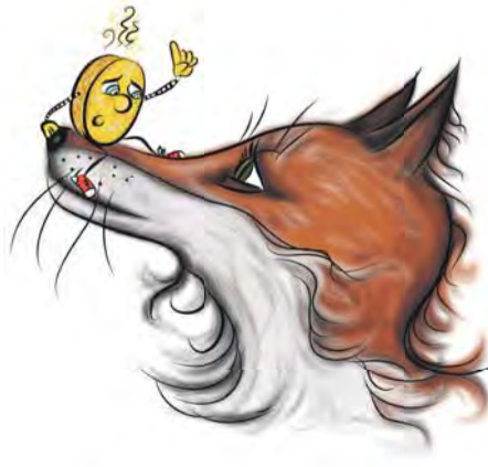
Loštice nabízejí hru se sbíráním razítek do mapy, kterou je možné vyzvednout si na sedmi místech ve městě.

„Dali byste si tvarůžkovou zmrzlinu nebo kremroli s tvarůžkovým krémem? Už jste někdy slyšeli o ojedinělém živočišném druhu kundabě? A kde se vlastně Bystrouška zje-