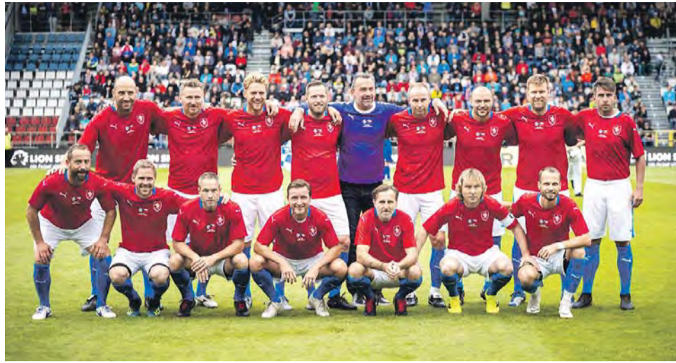
Výběr české reprezentace přehrál tým legend Sigmy 9:2. Vrcholem programu bylo přejmenování východní tribuny, která nyní nese jméno olomouckého rodáka a trenérské ikony Karla Brücknera.

Kvůli zranění Jaromíra Blažka musel do brány, pů-