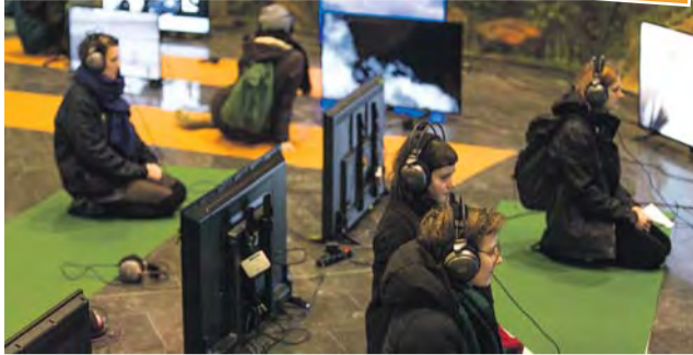
Součástí programu přehlídky filmové animace bude předávání Ceny Jindřicha Chalupického.

Kompletní uvedení večerníčku O klukovi z plakátu nebo promítání animovaných filmů na neobvyklých místech, třeba v knižním antikvariátu. Pestrý program už po osmnácté nabídne Přehlídka filmové animace a současného umění v Olomouci a to od 5. do 8. prosince. Hlavním tématem je fenomén portrétního umění, jak s ním pracují současní umělci, filmaři a hudebníci. „Zobrazení lidského obličeje je jedním z nejčastějších motivů v umění, s nástupem mobilních technologií se lidskému obličejí v mediálním prostoru téměř nedá uniknout. To neušlo zahraničním i českým umělcům, a právě