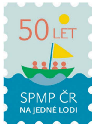
Předchůdce Společnosti pro podporu lidí s mentálním postižením vznikl před padesáti lety v Olomouci.

Velkého rozkvětu dosáhlo SPMP po roce 1989. Začaly vznikat nové, většinou okresní organizace, zaměřené na spolkovou činnost. Na území kraje je dnes najdeme v Olomouci, Prostějově, Přerově a Šumperku. „Významný posun byl i v péči a vzdělávání lidí s mentálním postižením, a tak byla pod hlavičkou naší organizace zakládána i nová zařízení například v Praze, Kladně, Ostravě. V důsledku působnosti Nového občanského zákoníku se