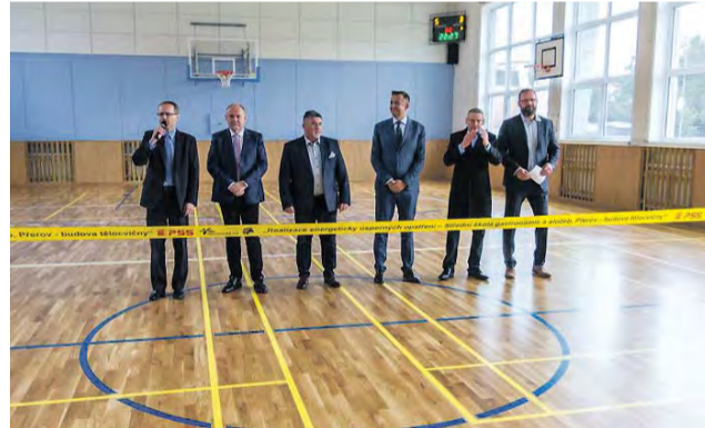
V Přerově se opravy zaměřily na zateplení a vzduchotechniku. Náklady za energii na vytápění tak budou nižší.

Opravy snížily energetickou náročnost budovy a tím i spotřebu energie potřebné pro vytápění. Projekt byl rozdělen na dvě části – kromě zateplení došlo i na instalaci vzduchotechniky. „Ta stála téměř dva miliony korun. Část nákladů pokryla dotace z operačního programu životního prostředí,“ uvedl náměstek hejtmána pro oblast školství Ladislav Hynek.