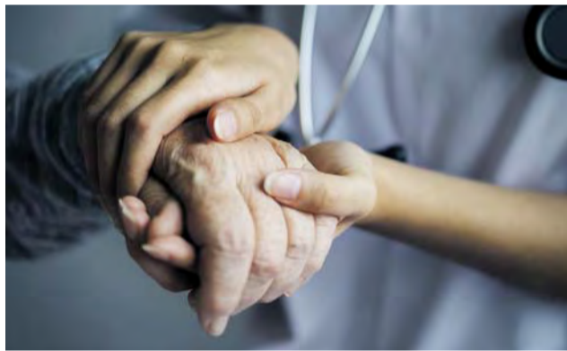
Podpora sociálních služeb pro seniory je krajskou prioritou. Ilustrační foto

Kraj ze svého rozpočtu dotuje provoz mnoha domovů pro seniory, přispívá na provoz charity a peníze posílá desítkám dalších organizací, jež se starají o ty, kteří se bez cizí pomoci neobejdou. (red)