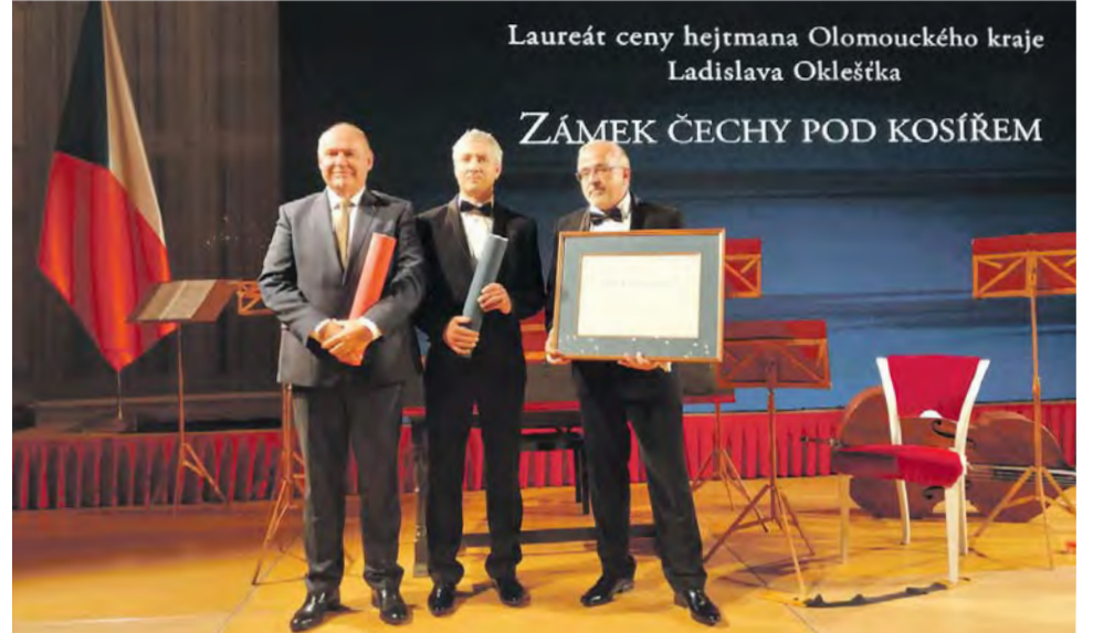
Zámek Čechy pod Kosířem získal v internetovém hlasování přesně 28 026 hlasů.

Prestižní Cenu Opera historica 2019 za pozitivní vliv památky na regionální rozvoj a cestovní ruch České republiky převzal ve čtvrtek 3. října ve Španělském sálu Pražského hradu hejtmán společně s ředitelem Vlastivědného